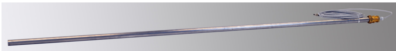
Erdsensor 140 mit serieller Schnittstelle